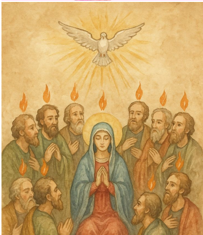
PENTECÔTE Dimanche 24 mai

Maison paroissiale, 9 rue Général Bouchu, 21120 IS SUR TILLE Maison paroissiale, 24 rue de la Patenée, 21260 SELONGEY Père Albert ZOUNGRANA, 9 rue Général Bouchu, 21120 IS SUR TILLE Père Hubert NAUDET, 21580 GRANCEY LE CHÂTEAU