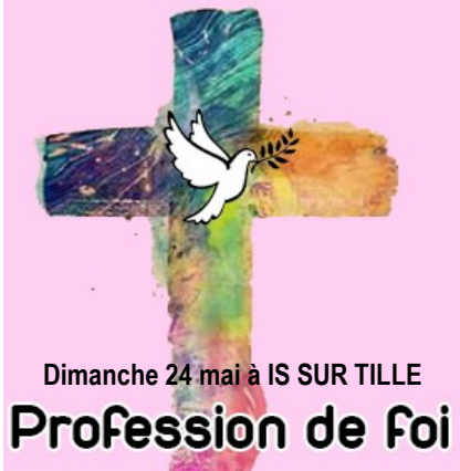
Dimanche 24 mai à IS SUR TILLE