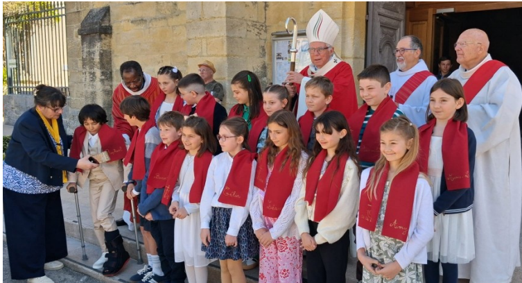
CONFIRMATION dimanche 26 avril 2026 à IS SUR TILLE